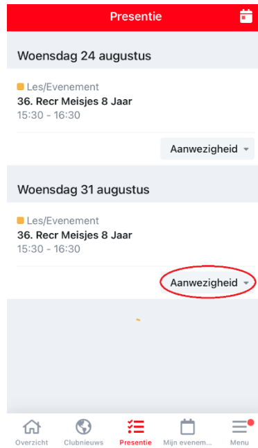
Voorbeeld van een presentieoverzicht

Door op de knop 'Aanwezigheid' bij de betreffende les te drukken, kan je jouw aan- of afwezigheid doorgeven.