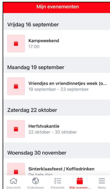
Voorbeeld van mijn evenementen

De onderstaande opties staan genoteerd onder de knop 'Menu'